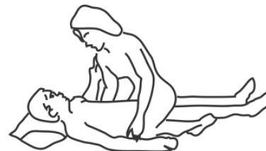
La personne handicapée par l'AVC est allongée sur le dos

Au cours d'un rapport sexuel, il n'y a pas de risque direct d'accident cardiaque ou de récurrence d'AVC